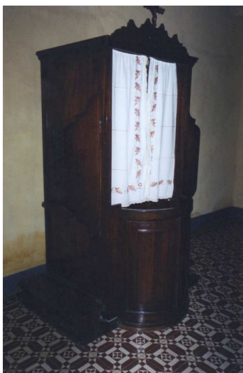
O confessionário, o mesmo de cinquenta anos atrás, onde deixei meus pecados de criança.