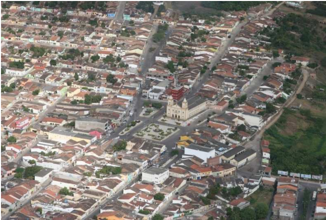
Bom Conselho-PE. Ao centro a Matriz da Sagrada Família.