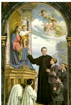
São João Bosco