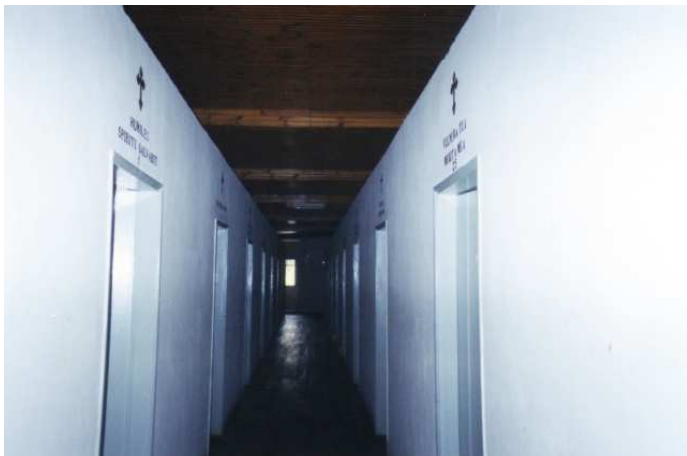
As “celas” das freiras. Território proibido quando eu era criança. Hoje, a gente entra, fotografa, ninguém se importa.