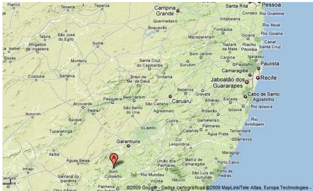
Mapa mostrando Campina Grande, Recife e Bom Conselho assinalado com a letra A.