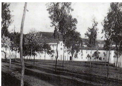
Assim era o colégio, na década de 1950.