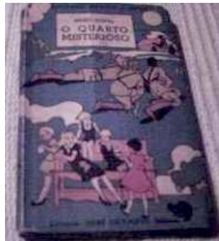
Os livros da Coleção “Menina e Moça”.