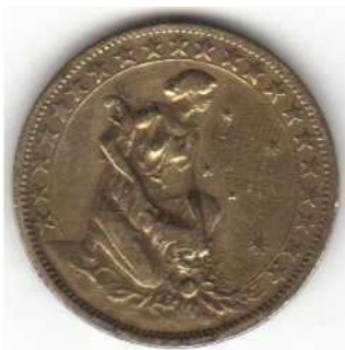
Moeda de dez tostões, ou “destões”