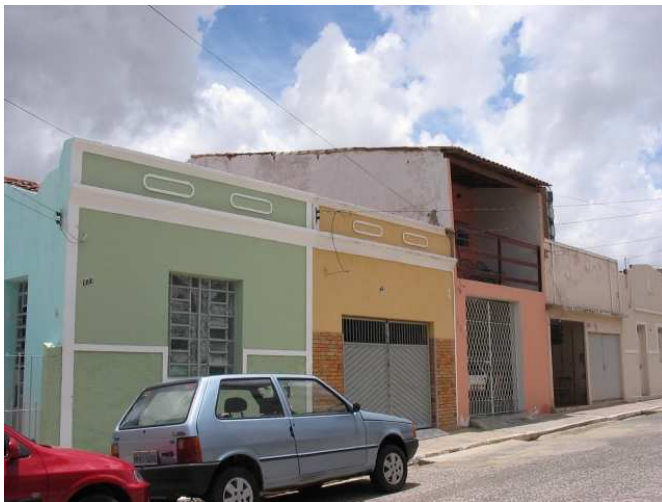
A nossa casa ficava onde está essa garagem com parede amarela. Mas era igual à ultima casa à direita, de porta e janela.