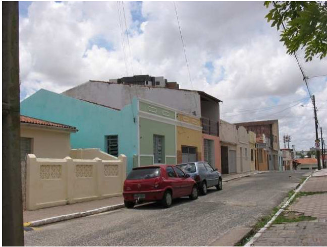
Rua Solón de Lucena, foto atual.