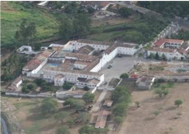
O Colégio, vista aérea.