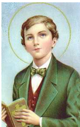
São Domingos Sávio