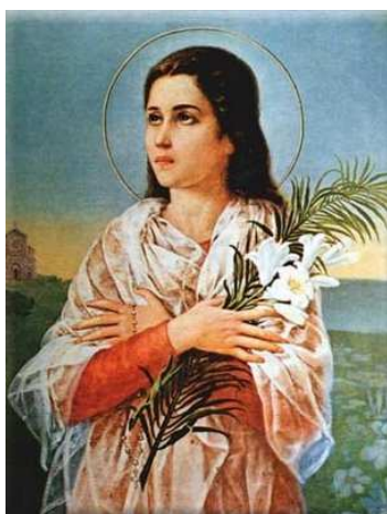
Santa Maria Goretti