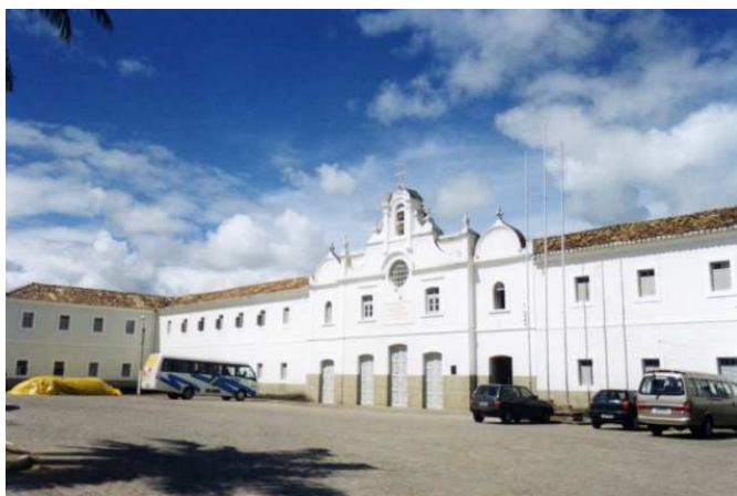
Fachada do colégio. Foto de 2005.